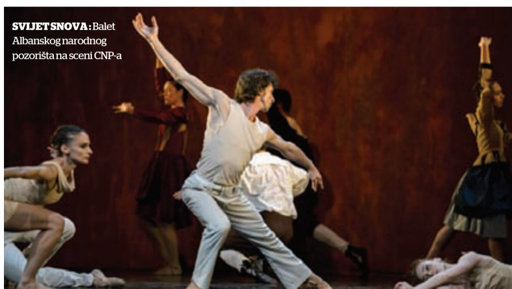
SVLJETSNOVA: Balet Albanskog narodnog pozorišta na sceni CNP-a

Izuzetno mlad ansambl, koji u ovoj koreografiji broji 12 članova, Preljocaj dijeli u dvije